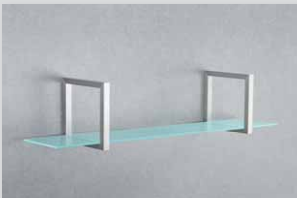
inkl. Montagematerial / verdeckte Bohrlöcher