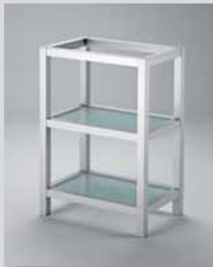
Abb. mit zwei Glasböden

Bohrungen für Bodenträger, bitte Boden Angeben (Glas,Arbeitsplatte etc.)