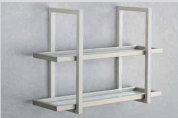
inkl. Montagematerial / verdeckte Bohrlöcher