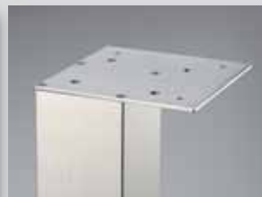
auf Eck montiert

Die Befestigungsplatte ca. 90 x 90 mm kann mittig oder auf Eck montiert werden