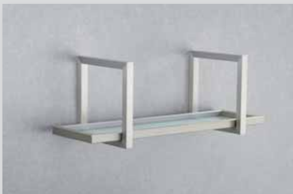
inkl. Montagematerial / verdeckte Bohrlöcher