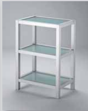
Abb. mit drei Glasböden