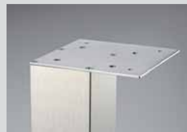
Anschraubplatte 140 x 140 mm